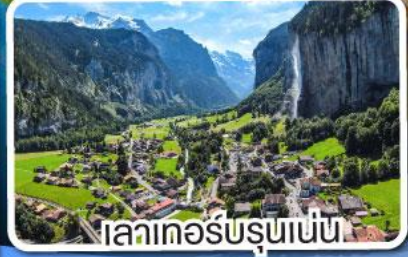
เลาเคอร์บรุนเนน