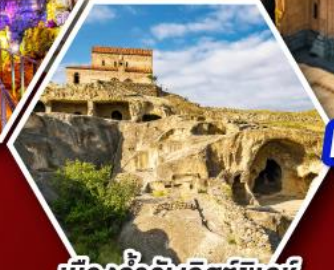
เมืองถ้ำอ์พลิสต์ซิคเคห์

พัก Rooms Hotel โรงแรมวิวทิวทัศน์ของเทือกเขาคอเคซัส