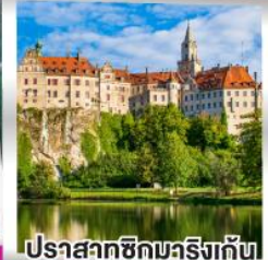
ปราสาทชิกมารังกัน