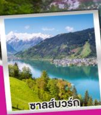
ชาลส์บวร์ค

การันตีพิกค้ำคืนบน ยอดเขาริกิ ราชินีแห่งขุนเขาสวิตเซอร์แลนด์