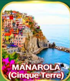
MANAROLA (Cinque Terre)