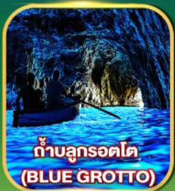
ถ้ำบลูกรอตโต (BLUE GROTTO)