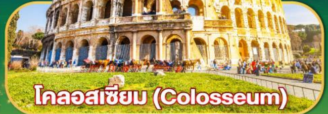
โคลอสเซียม (Colosseum)