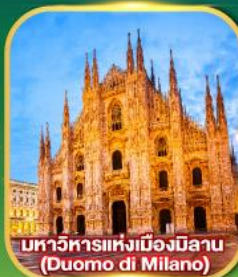
มหาวิหารแห่งเมืองมิลาน (Duomo di Milano)