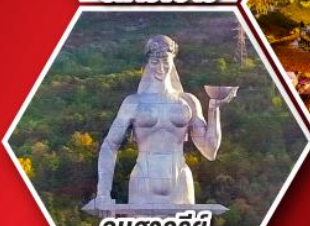
อนุสาวรีย์