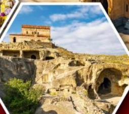
เมืองดำอ์พลิสต์ซิคเค์

พัก Rooms Hotel โรงแรมวิวทิวทัศน์ของเทือกเขาคอเคซัส