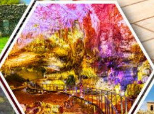
ดำไฟรมีร์จอส