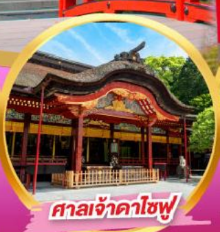
ศาลเจ้าคาโซฟู