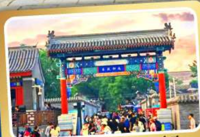
ถนนโบราณหนานหลิวกู่เซียง