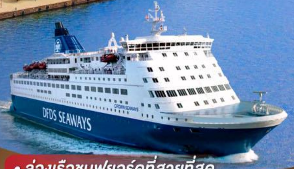
• ล่องเรือชมฟยอร์ดที่สวยงามที่สุด