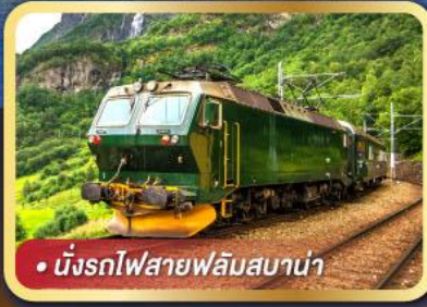
• นั้รงรถไฟสายฟลัมสบาน่า