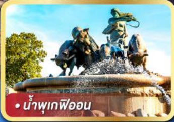
• น้ำพุเทพีออน