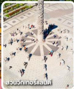
สวนจอกอร์แลนด์