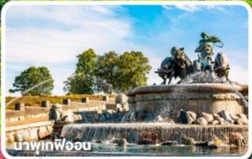
น้ำพุที่ฟ็อน