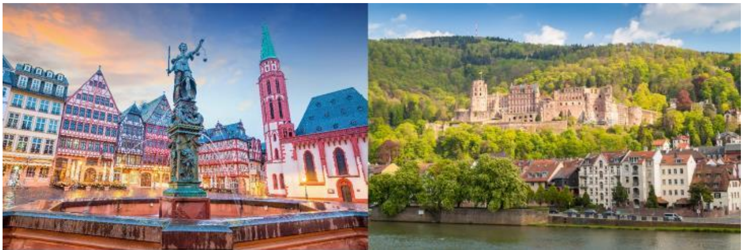
เป็นที่ตั้งของมหาวิทยาลัยไฮเดลเบิร์ก ซึ่งเป็นมหาวิทยาลัยแห่งแรกของเยอรมัน ด้วยความสวยงาม