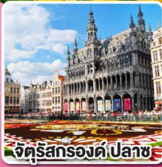
จัตุรัสกรองด์ปลาซ

ล่องเรือหลังคากระจาก ชมความสวยงาม ของกรุงอัมสเตอร์ดัม