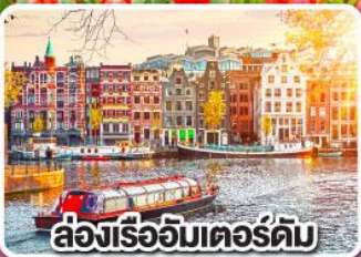
ล่องเรืออัมสเตอร์ดัม