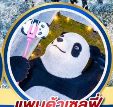
แพนต้าเซลฟี