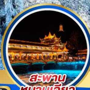
สะพาน หนานเจียว