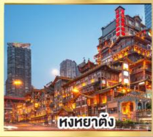
หงหยาดิง