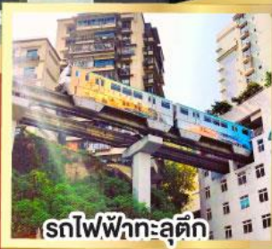
รถไฟฟ้าทะลุติ๊ก