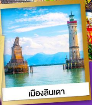
เมืองลินเดา