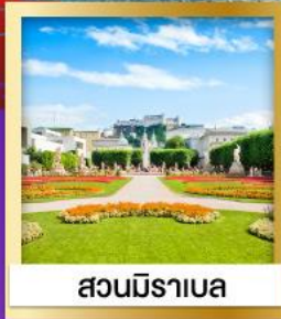
สวนมิราเบล