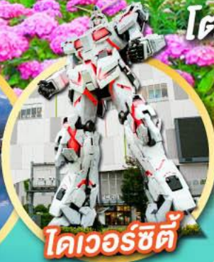
โดเวอร์ซิตี