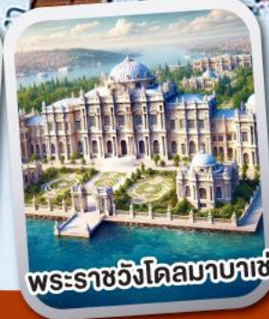
พระรลลว้งดลลลลลลลล