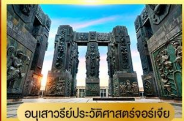
อนุสาวรีย์ประวัติศาสตร์จอร์เจีย

11-18 ต.ค. / 25 ต.ค.-01 พ.ย. 67 พิเศษ!! พัก ROOMS HOTEL ชมวิวสุดอลังการของเทือกเขาคอเคซัส