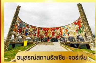
อนุสรณ์สถานรัสเซีย-จอร์เจีย

นั่งรถ 4WD ตะลุยสู่ใจกลางเทือกเขาคอเคซัส | เข้าชมวิหารศักดิ์สิทธิ์ ซามิบา เที่ยวเมืองท่าอันเก่าแก่ อพลิสต์ซิคห์ | พิเศษ มีอาหารไทย ณ กรุงทบิลีซี