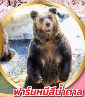
ฟาร์มหมีสีน้ำตาล