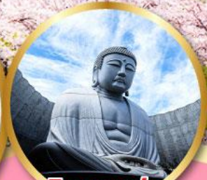
เป็นเขาแห่ง พระพุทธรเจ้า