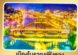
เมืองโบราณเฟิงหวง