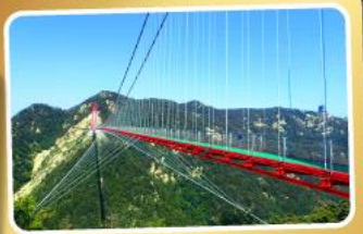
สะพานแวนอ้ายจ้าย