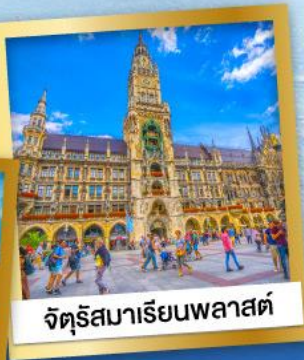
จัตุรัสมาเรียนพลาสต์