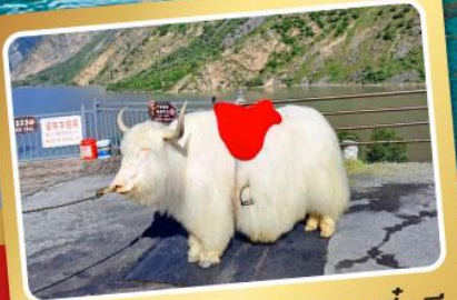
จามริกะเลสาบเตี้ยซี