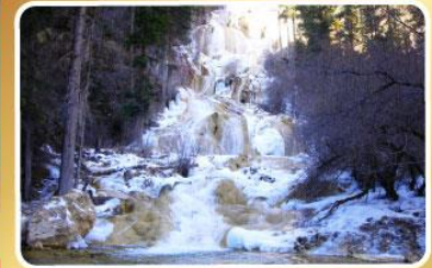
อุทยานโหมวหนี่โกว