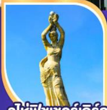
จูโห่พิซเซอร์รี่