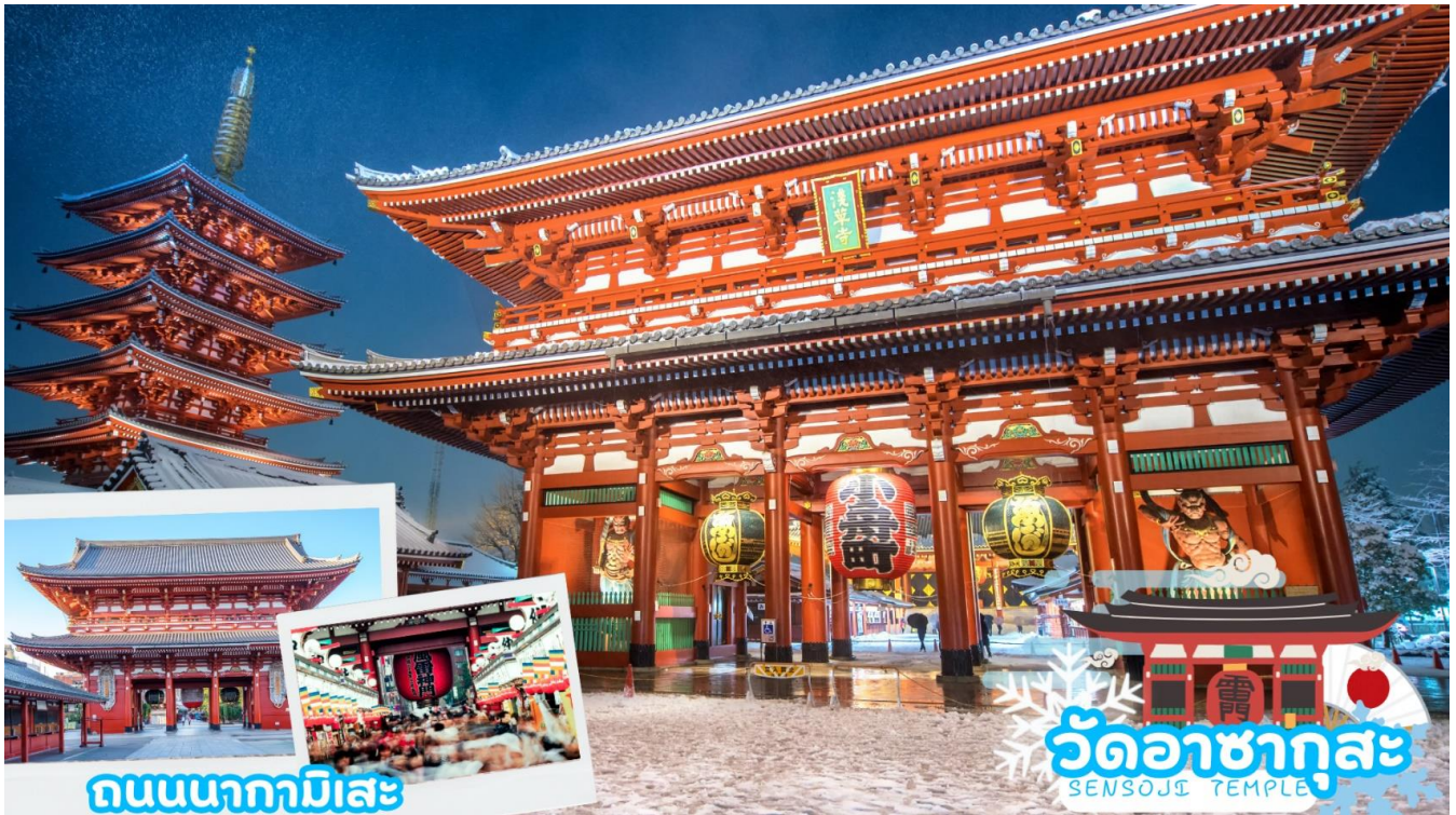
ถนนนากามิसे