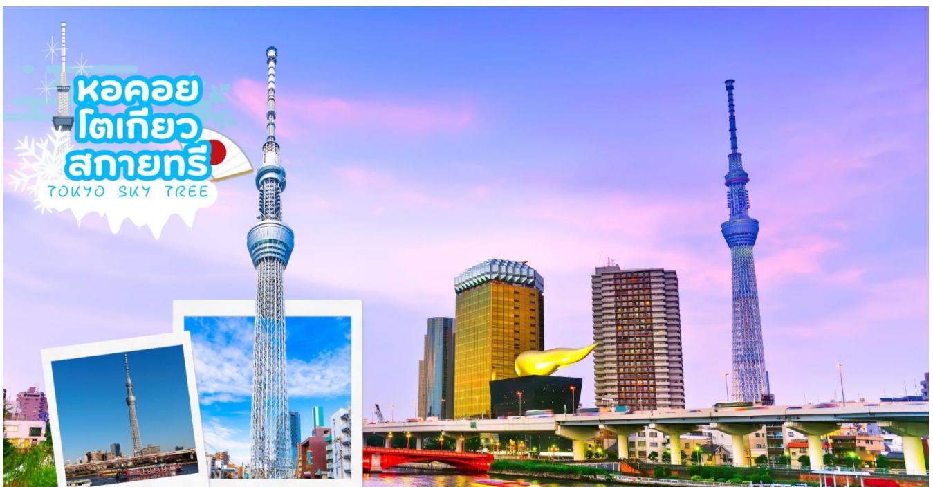
หอคอยโตเกียวสกายทรี TOKYO SKY TREE

เดินสูริรมแม่น้ำซูมิตะ อิสระให้ท่านได้ถ่ายรูปเก็บภาพความประทับใจหอคอยที่สูงที่สุดในโลก หอคอยโตเกียวสกายทรี (Tokyo Sky tree) ที่เปิดเมื่อ 22 พฤษภาคม 2555 มีความสูง 634 เมตร และสามารถทำลายสถิติความสูงของหอคอยต่าง ในมณฑลกว่างโจว ซึ่งมีความสูง 600 เมตร กับ CN Tower ในนครโตรอนโต ของแคนาดา ที่มีความสูง 553 เมตร