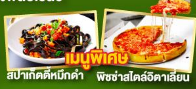
เมนูพิเศษ สปาเกตตีหมึกดำ พิชซ่าสไตล์อิตาลี