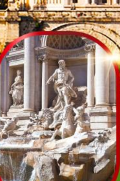
น้ำพุเทรวี่