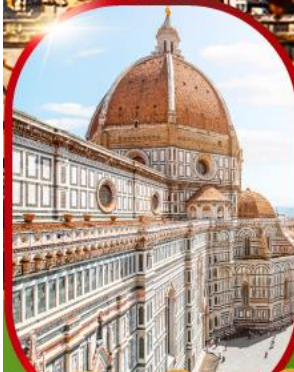
มหาวิหารฟลอเรนซ์