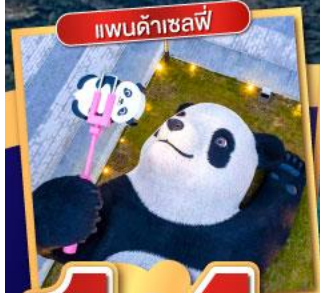
แพนด้าเซลฟ์