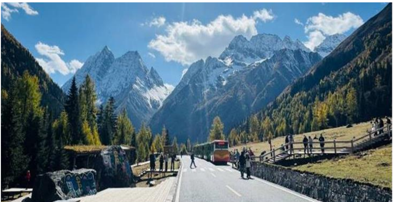
G01TFU-TG108 เฉิงตู สี่ดรุณี ป่าเฉิงโกว ต่ากู่ปิงชว่น จิวจ้ายโกว 7วัน 6คืน (นั่งรถไฟความเร็วสูง) * ไม่ลงร้านช้อปปิ้ง โดยสายการบิน Thai Airways (TG)

เช้า รับประทานอาหารเช้า ณ ห้องอาหารภายในโรงแรม ( มื้อที่ 2 )