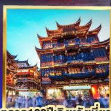
ตลาด100ปีสิงหวังเมี่ยว