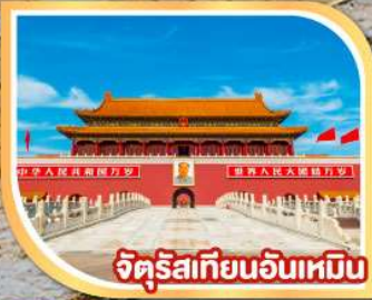
จัตุรัสเทียนอันเหมิน