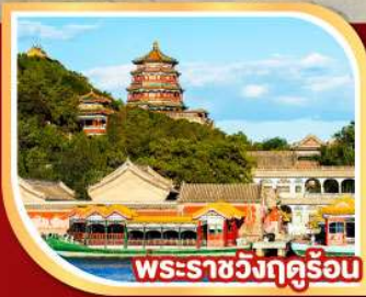
พระราชวังฤดูร้อน