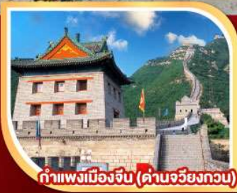
กำแพงเมืองจีน (ด่านจวิรงกวน)