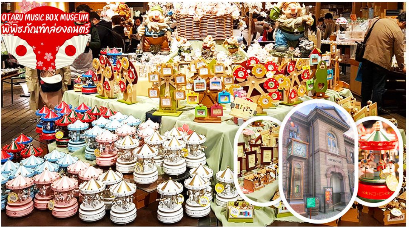
พิพิธภัณฑ์กล่องดนตรี อาคารเก่าแก่สองชั้นที่ภายนอกถูกสร้างขึ้นจากอิฐแดง แต่โครงสร้างภายในทำด้วยไม้ พิพิธภัณฑ์แห่งนี้สร้างขึ้นในปี 1910 ปัจจุบันนับเป็นมรดกทางสถาปัตยกรรมที่เก่าแก่และควรค่าแก่การอนุรักษ์ให้เป็นสมบัติของชาติ