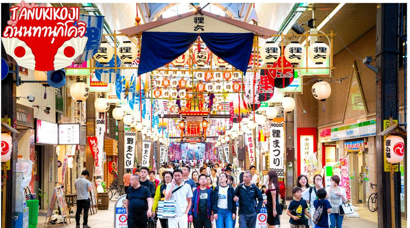
ช้อปปิ้ง ถนนทานุกิโคจิ (Tanukikoji) เป็นย่านช้อปปิ้งเก่าแก่ ที่เปิดให้บริการยาวนานกว่า 100 ปี จุดเด่น