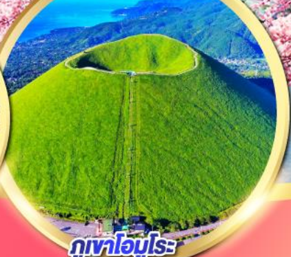
ภูเขาโอโมโระ