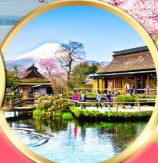
หมู่บ้านน้ำใสโอชิโนะฮักโก