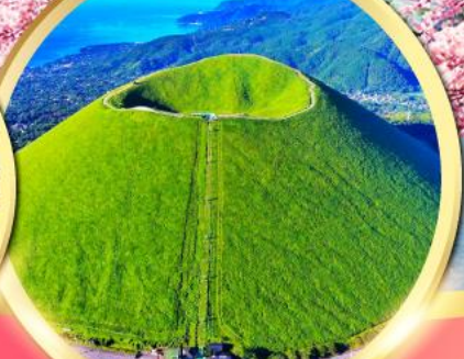
ภูเขาโอโมโระ