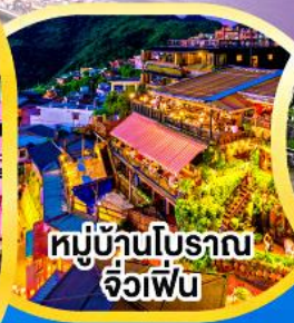
หมู่บ้านโบราณ จิวเฟิ่น