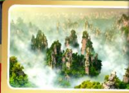
เขาอวตาร