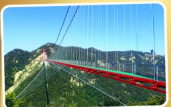
สะพานแวนอ้ายจ้าย