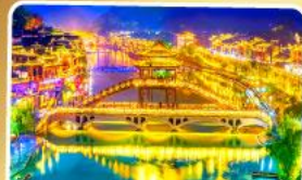
เมืองโบราณฟิ่งหวง