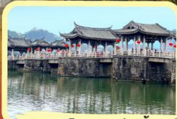
• สะพานโบราณกว่างจี้