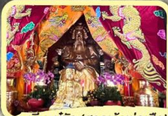
• เอียงบู๊ซิว (ศาลเจ้าพ่อเสือ)