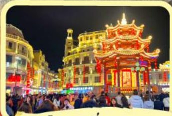
• ถนนโบราณเสี่ยวกงหยวน