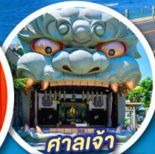
ศาลเจ้า นิมบะยาซากะ