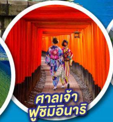
ศาลเจ้า ฟูชิมิอินาริ