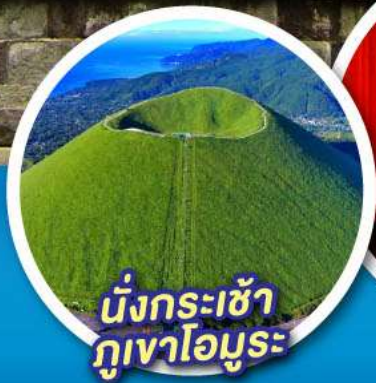
นั่งกระเช้า กุเอาโอมูระ

จุดชมวิวกุเอาไฟฟูจิ ป่าสนมิโฮะ โนะมัตสึบาระ