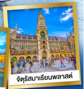
จัตุรัสมาเรียนพลาสต์