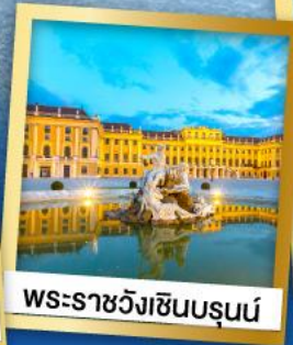
พระราชวังเซ็นบรุนน์