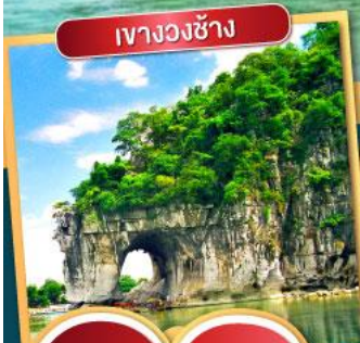
เวางวงซ้าง