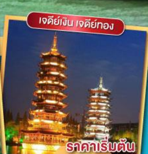
เจดีย์จิน เจดีย์ทอง