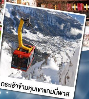
กระเช้าข้ามหุบเขาแกมมีพาส

18-24 ก.พ. 68 11-17 มี.ค. 68 29 เม.ย.-05 พ.ค. 68