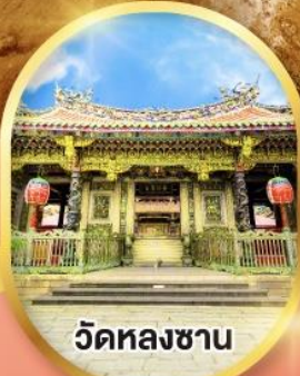
วัดหลงซาน