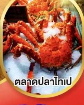
ตลาดปลาไทเป