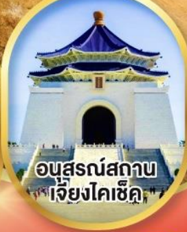
อนุสรณ์สถาน เจียงไคเช็ค