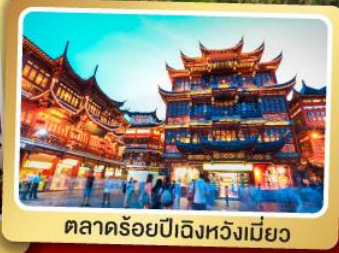
ตลาดร้อยปีเฉิงหวังเหมียว