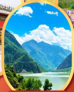
ทะเลสาปเต๋ยซี