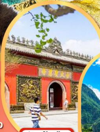
วัดต้าฉี