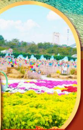
สวนสวรรค์แห่งดอกไม้ Manhua Manor