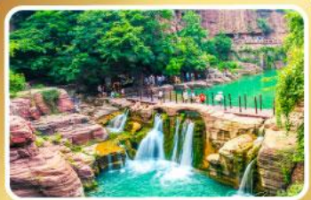
อุทยานหยุ่นโกซาน