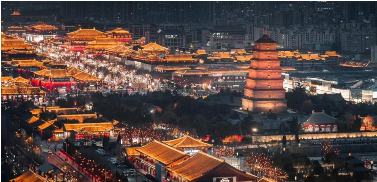
ค่ำ รับประทานอาหารค่ำ ณ ภัตตาคาร (มื้อที่ 12)