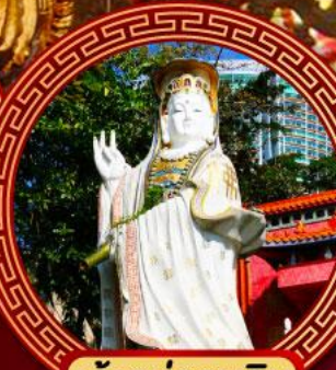
เจ้าแม่กวนอิม รีพัลส์เบย์