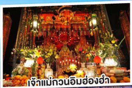
เจ้าแม่กวนอิมฮ่องฮำ