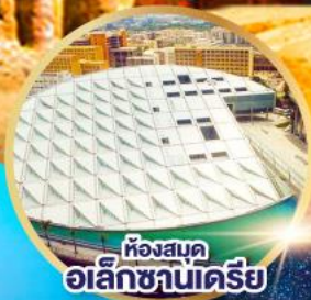
ห้องสมุด อเล็กซานเดรีย