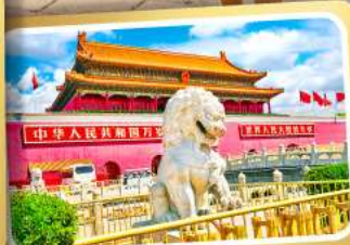
จุดตรัสเทียนอันเหมิน