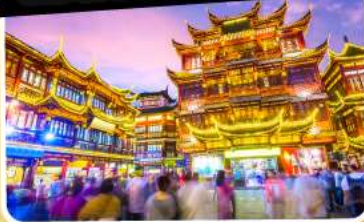
ตลาดร้อยปีเจิ้งหวงเมี่ยว