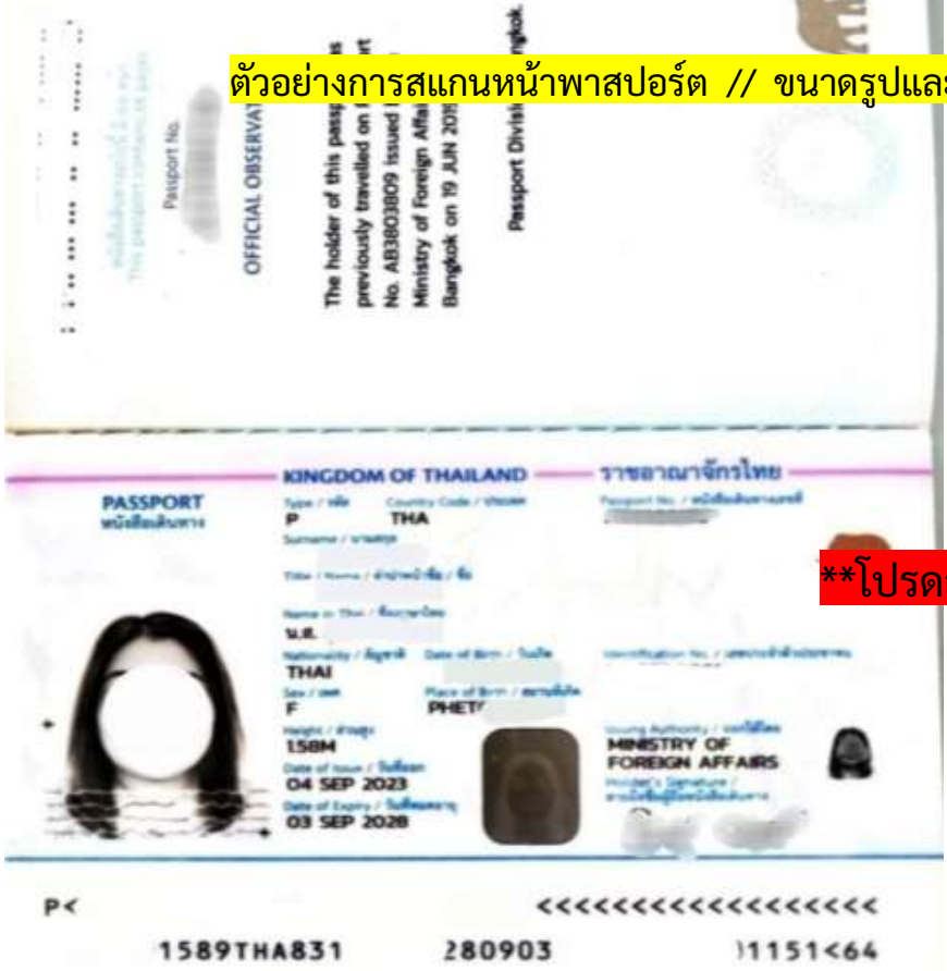
ตัวอย่างการสแกนหน้าพาสปอร์ต // ขนาดรูปและภาพของผู้เดินทาง