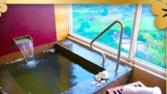
แช่ออนเซ็น