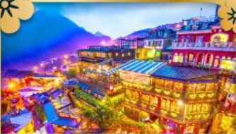
หมู่บ้านโบราณจิวเฟิ่น