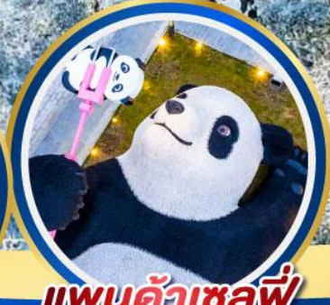
แพนต้าเซลฟี