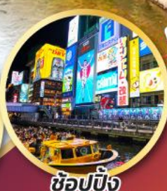
ช้อปปิ้ง โดตงโบรี

ชมซากุระพร้อมใบไม้เปลี่ยนสี เมืองโอบาระ ชมใบไม้เปลี่ยนสี ณ หุบเขาโคริงเค