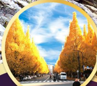
ถนนใบไม้ที่สวยงาม โอซามามิกิ