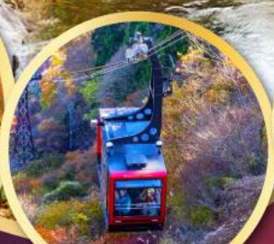
ชมใบไม้เปลี่ยนสี วัดคูออนจิ