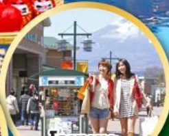
โทเกมบะ- พรีเมียมเอาก์เล็ท